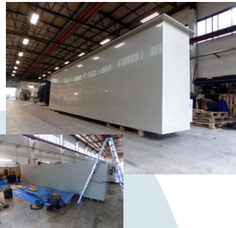
Bestandsaufnahme Stahlwanne m. Rissen, Aufmaß für den Inliner, Freigabezeichnung, Vorfertigung.