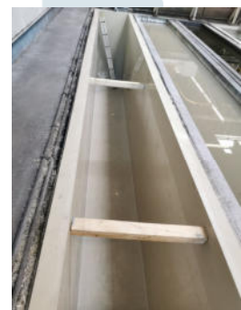
Einbau vor Ort mit der Unterstützung durch den Auftraggeber, Fertigstellung.

Wir erarbeiten für Sie die passende Lösung mit System. Sprechen Sie uns einfach an. Wir machen das!