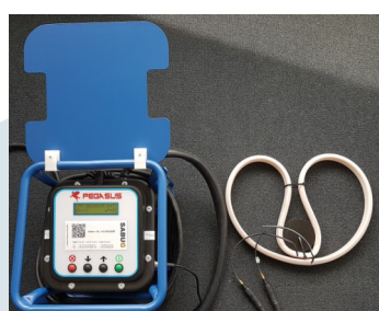
Einsetzen d. Schweißringes