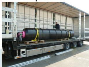
PE Ziehkopf d800