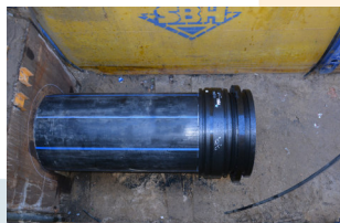
PE E-Bund-E-Muffe d1.020