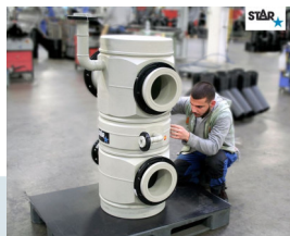
PP Sonderverteiler d450