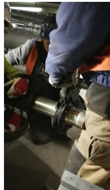
Montage in Stellung d 108