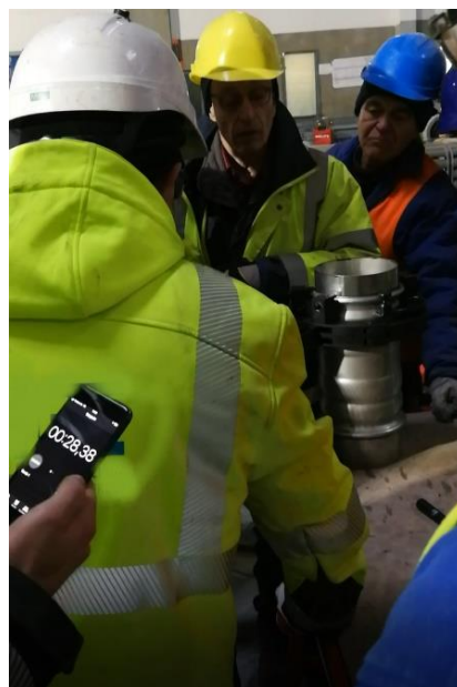
Verarbeitungszeit ca. 30 Sek.