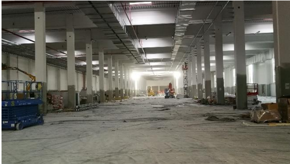
Blick in die Produktionshalle