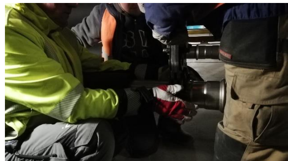
Weiter Pressung in Stellung d 108