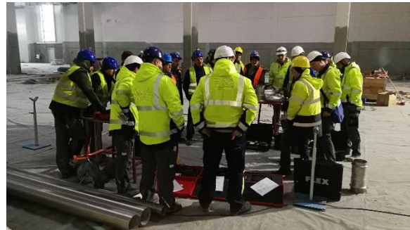
Einweisung Maschine Preßtechnik