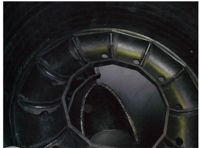
Energieumwandlungsbauwerk DN 2400