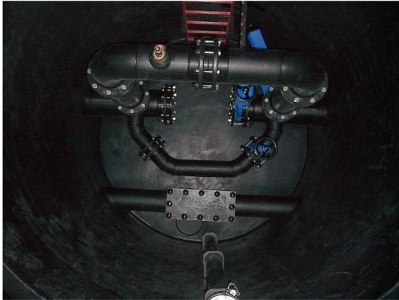
Armaturen-/Reinigungsschacht DN 1800