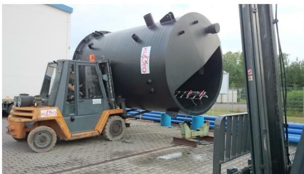
BV Culmitzsch – Pumpenschacht DN 3000