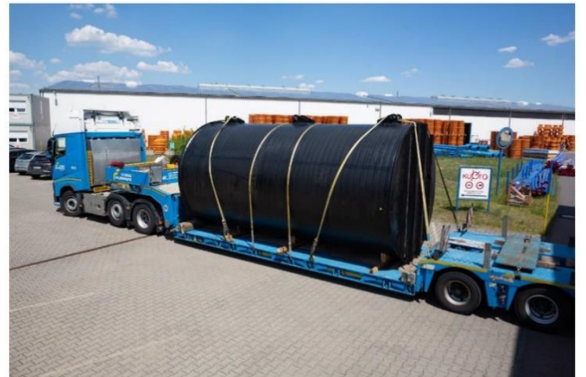
Trinkwasserspeicher DN 2700 Niederhausen