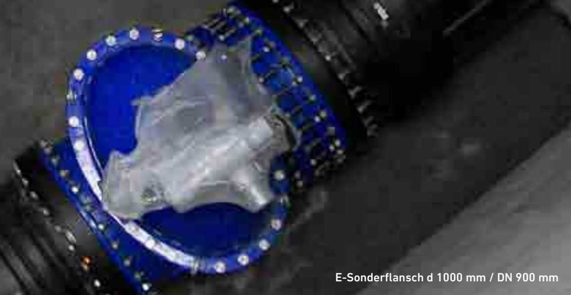
E-Sonderflansch d 1000 mm / DN 900 mm